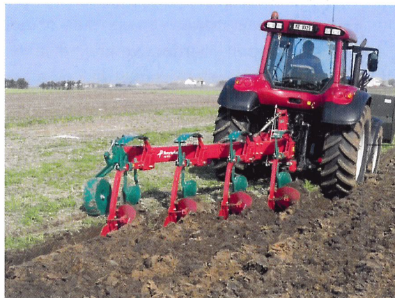
Afb. 1.46 Ploegen zijn er in verschillende soorten en maten.