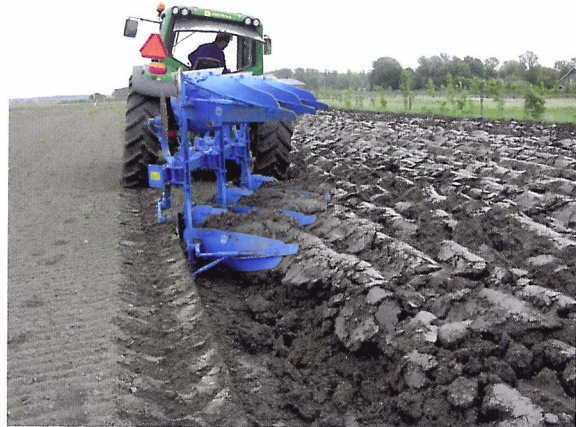
Afb. 1.45 Ploegen is één van de belangrijkste bewerkingen van de grond.

Om producten te kunnen verbouwen op het land, moet de boer elk jaar zijn grond bewerken en klaar maken om in te zaaien. Dit doet hij met machines achter en voor de tractor. Ook in tuinen moet de grond elk jaar bewerkt worden. De grond moet maak je los en bemest je voordat je gaat zaaien. Een moestuin moet je elk jaar omspitten. Dit doe je met een schop. Daarna kun je de moestuin zaaiklaar maken door bijvoorbeeld te harken.