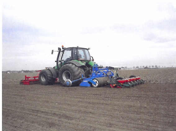
Afb. 1.47 Vaak wordt het bereiden van het zaaibed uitgevoerd met een combinatie van machines.